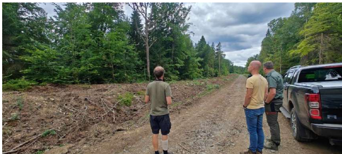
Visite de la future plantation d'une lisière étagée à Bouillon, avec des représentants de Spadel et du WWF.