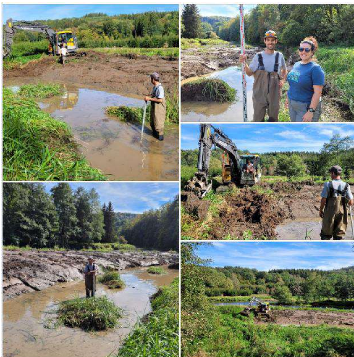
Restauration de frayères et creusement de mares.