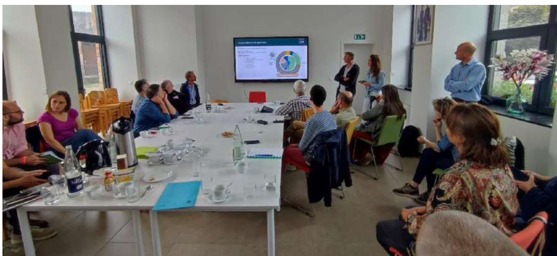
Présentation du PNVS au SPW ARNE à Herbeumont.