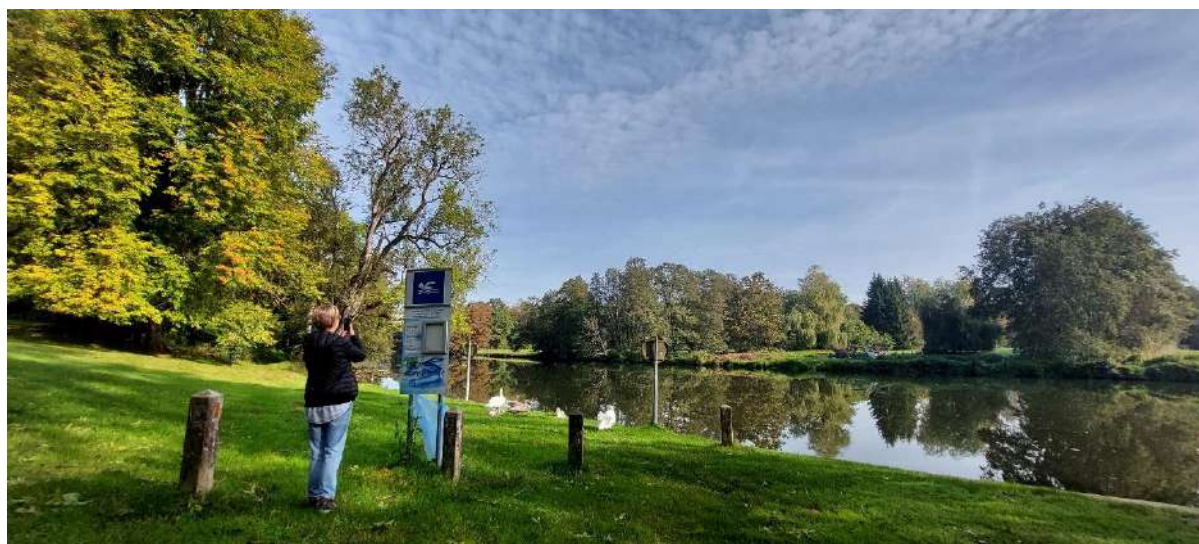
Recensement des aires de baignade officielles sur le territoire du Parc national de la Vallée de la Semois.