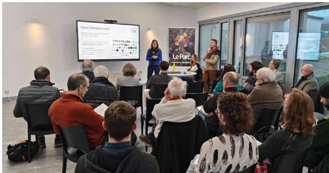
Première réunion du comité scientifique à Rossignol en présence d'environ 10 de ses membres.