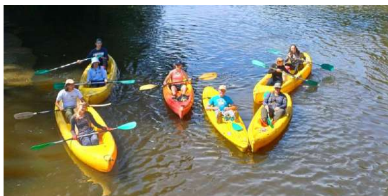
Campagne d'arrachage de la Balsamine de l'Himalaya à la fin de l'été 2023 avec l'aide d'étudiants.