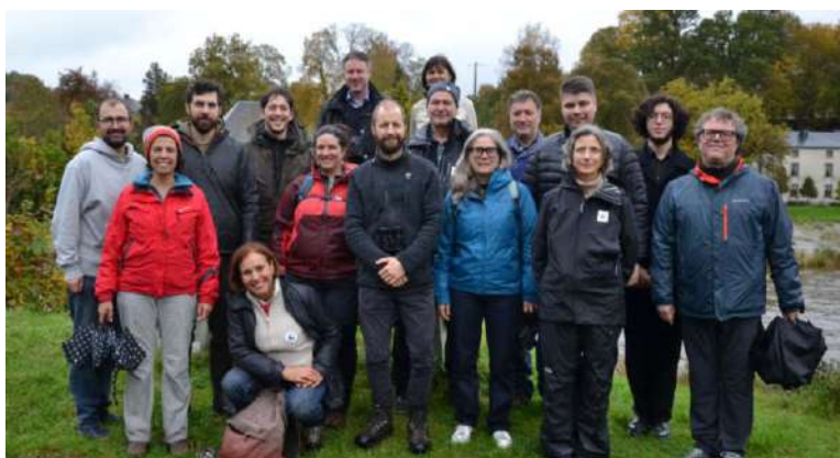
La coalition territoriale réunie lors de la visite des ministres Valérie Du Bue et Céline Tellier à Bohan.