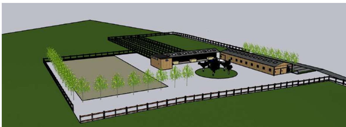
Esquisse 3D de la future station équestre, vue de face.