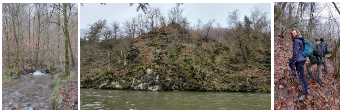
Sortie de terrain pour nos chargés de mission en compagnie d'agents du DEMNA, à la découverte des habitats patrimoniaux et sensibles.