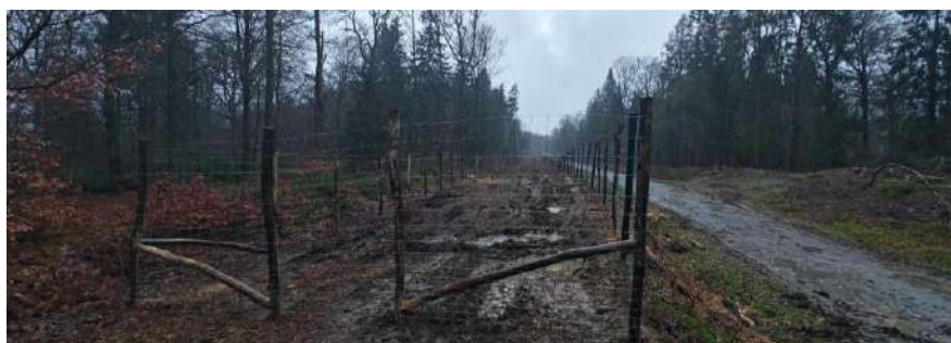
Plantation d'1 ha de lisière étagée mélangée sur le cantonnement de Bouillon.