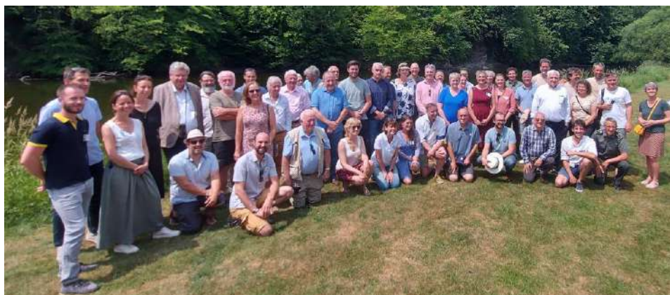
La coalition territoriale réunie lors de la visite des ministres Valérie Du Bue et Céline Tellier à Bohan.