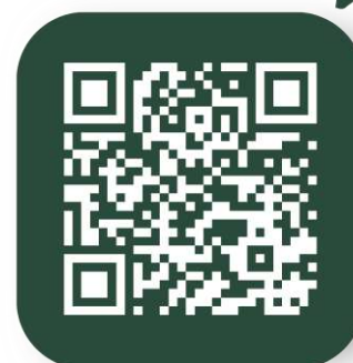
Site web de notre partenaire qui met avant les formations « Guide de rivière en Semois ».