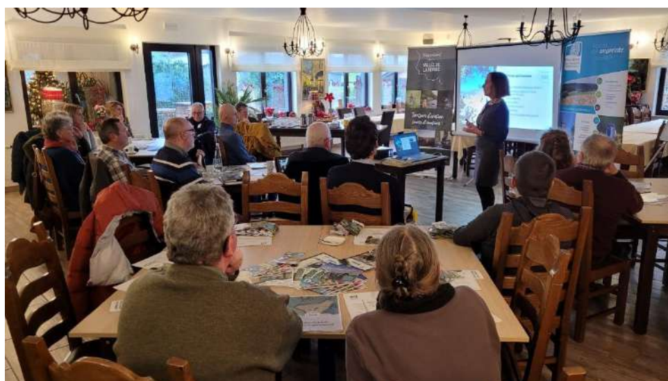
Réunion avec des guides du territoire organisée en décembre 2023 à Paliseul.