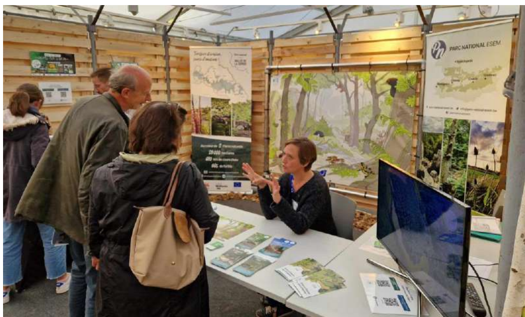
Stand du PNVS lors du Festival International Namur Nature en octobre 2023.