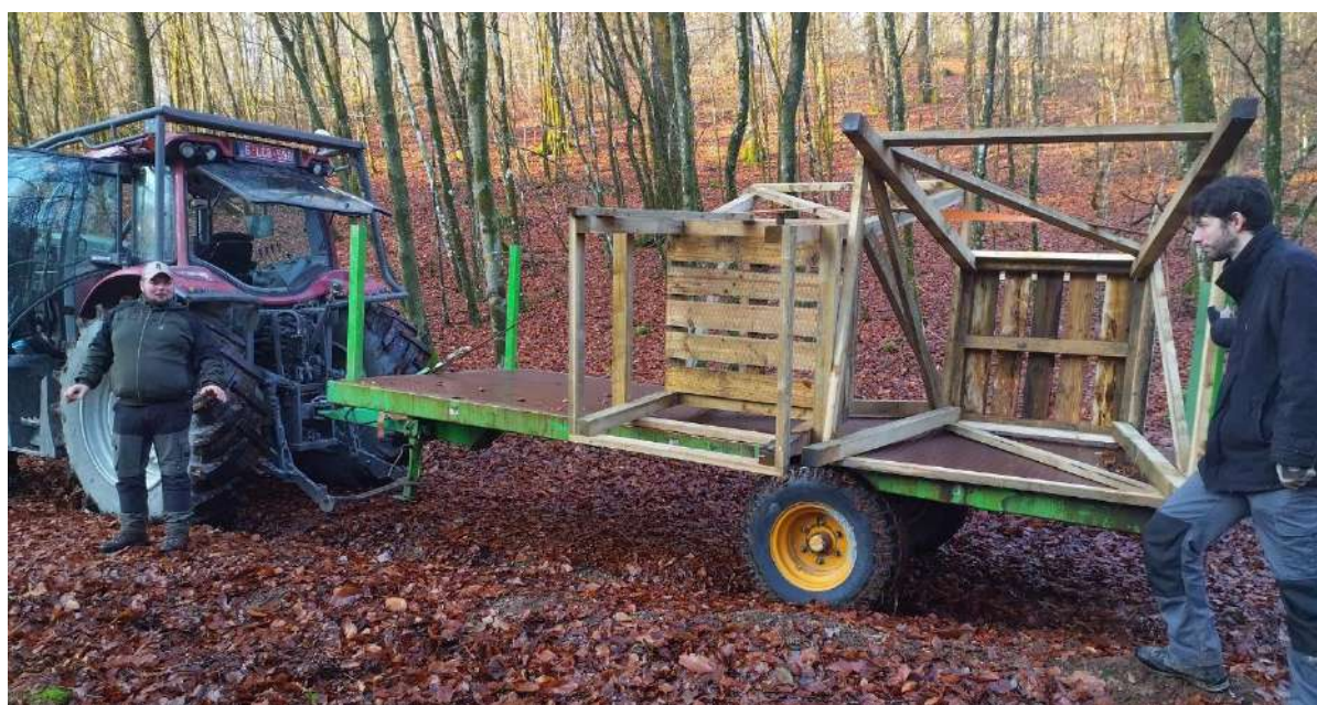
Installation de 18 premiers miradors en novembre 2023 pour les tests de la traque-affût.