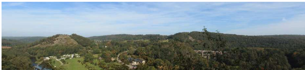
Point de vue de Libaipire, non loin du village d'Herbeumont.