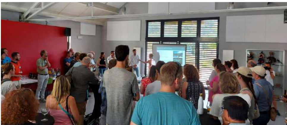
Présentation du PNVS au cabinet de la ministre Tellier à Vresse-Sur-Semois.