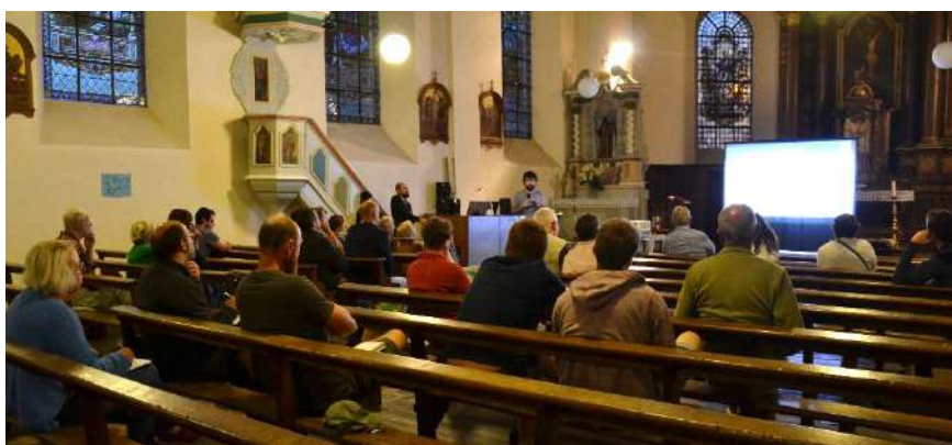
Conférence sur l'érosion de la biodiversité organisée dans le cadre de la fête du Parc Tiers-Lieu à l'église de Rossignol.