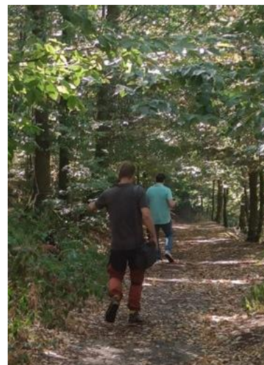
Repérages techniques sur le terrain – lancement du drone

Si le Parc national est retenu, les contacts seront donc relancés afin de poursuivre les démarches nécessaires.