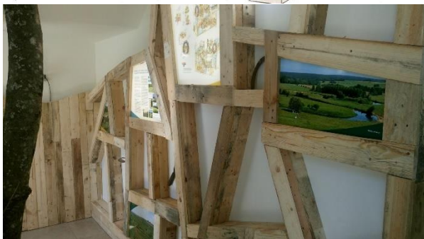
Espace éco-design au Château de Rossignol