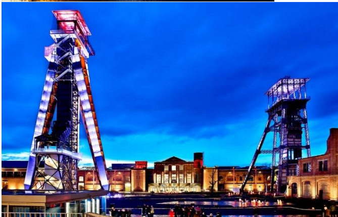
Exemple de scénarisation d'une mine à C-Mine (Parc national des Hoge Kempen)